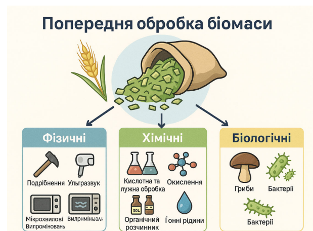
Рис. 2. Структура різних типів попередньої обробки біомаси

Подальше розкладання попередньо оброблених лігноцелюлозних компонентів відбувається шляхом ферментативного гідролізу (оцукрювання), в результаті чого утворюються простіші цукри (пентози та гексози) (Rezania et al., 2020). Отримані багаті на цукор гідролізати можуть бути піддані ферментації для виробництва різноманітних біопалив, таких як етанол, метанол, бутанол, а також інших біохімічних речовин. У промисловості зазвичай використовуються безпечні, стійкі та толерантні до етанолу мікроорганізми, такі як Saccharomyces cerevisiae та Zymomonas mobilis (Białas et al., 2010; Afedzi &