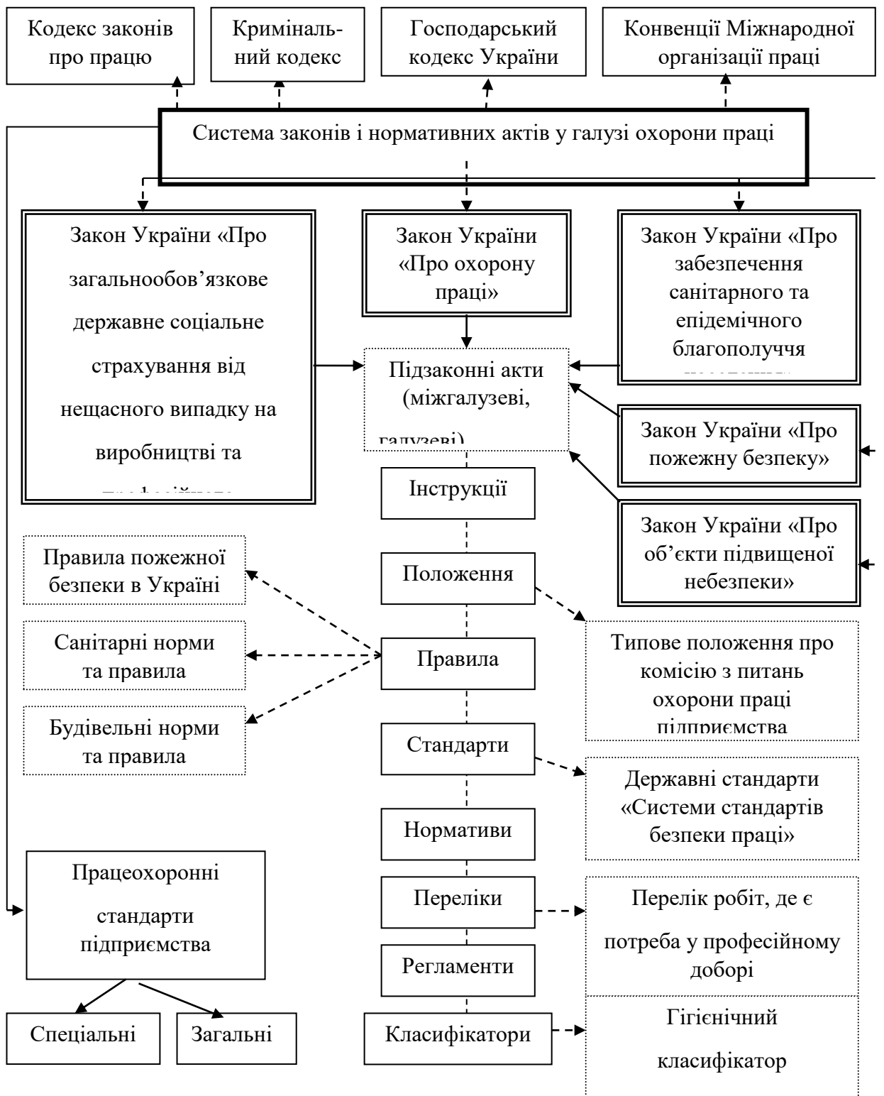
Рис.1. Блок-схема багаторівневої системи нормативних актів у галузі охорони праці

Вони відіграють важливу роль в охороні праці при забезпеченні працівників індивідуальної та колективної безпеки та гігієни праці в процесі трудової діяльності. Вимогам нормативних актів з охорони праці мають відповідати: