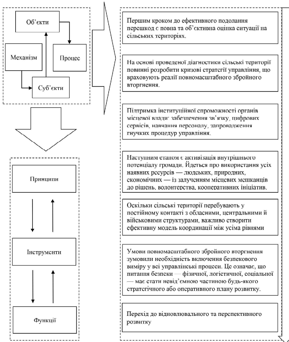
Рис. 2. Механізм подолання основних перешкод в системі управління розвитком сільських територій в умовах воєнного стану