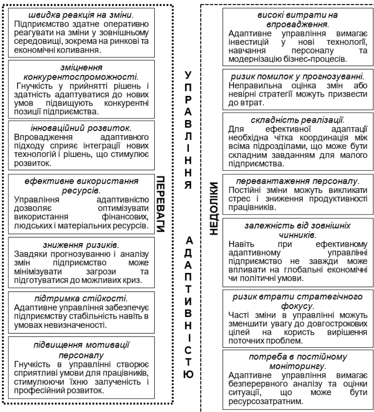
Рис. 3. Переваги та недоліки управління адаптивністю малого підприємства

йому швидко реагувати на зміни зовнішнього середовища та оптимізувати використання наявних ресурсів (рис. 3).