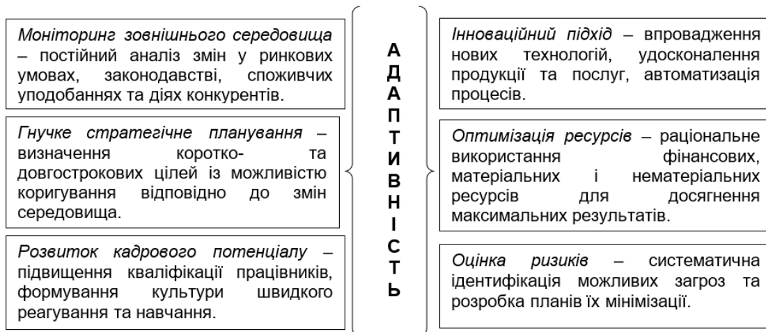
Рис. 1. Основні елементи управління адаптивністю малого підприємства

виток кадрового потенціалу, раціональне використання ресурсів та оцінку ризиків. Впровадження цих компонентів дає змогу підприємствам не лише оперативно реагувати на зміни, але й використовувати їх як нові можливості для розвитку.