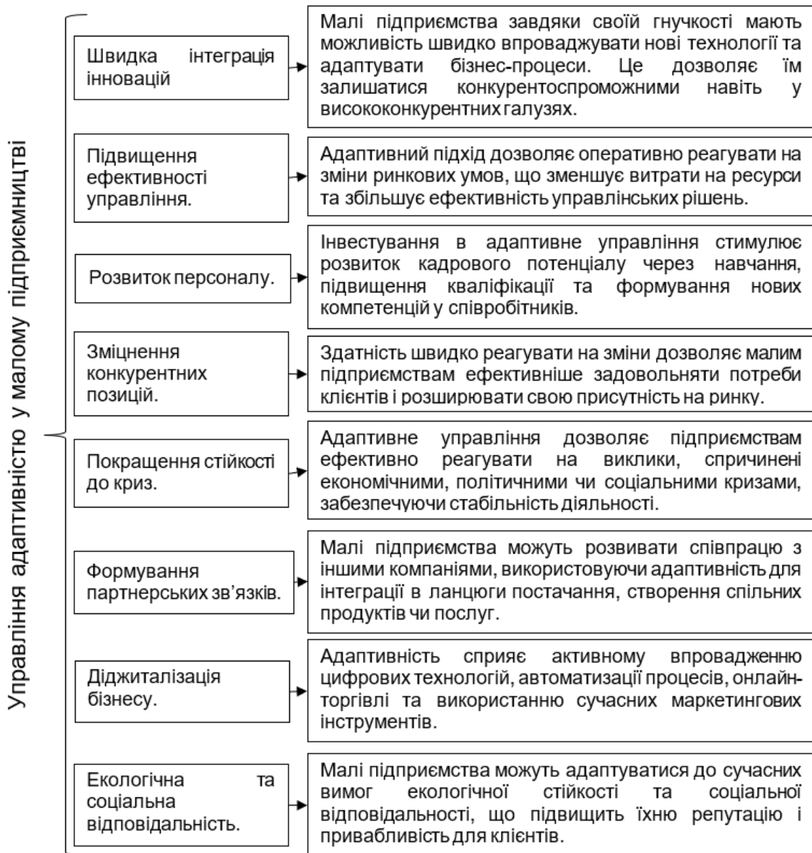
Рис. 4. Ключові перспективи управління адаптивністю у малому підприємстві

процесів та підвищення ефективності управлінських рішень. Розвиток персоналу через навчання та підвищення кваліфікації створює нові компетенції, необхідні для реагування на зміни.