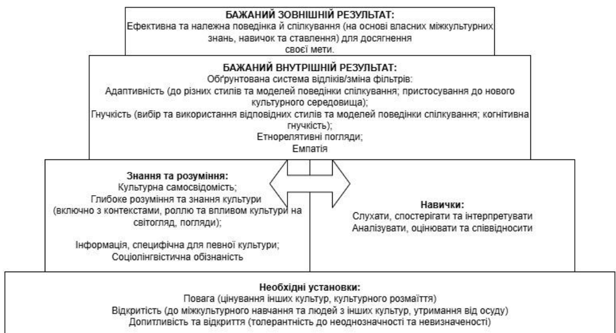
Рис. 1.1. Модель міжкультурної компетентності (за [22] – переклад за допомогою Google Translator)

Ця модель подає розвиток міжкультурної компетентності у вигляді піраміди, де кожен рівень спирається на попередній. Вона ілюструє логіку формування компетентності — від глибинних установок до зовнішньої поведінки [22] (рис. 1.1).