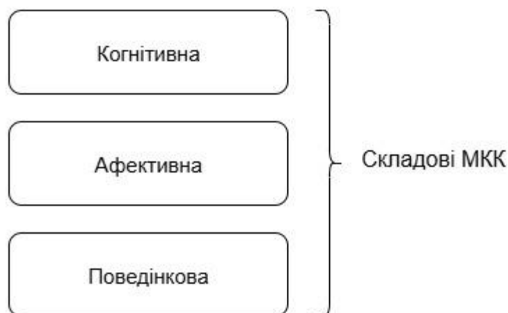
Рис. 2.3. Структура міжкультурної компетентності

Метааналіз 39 досліджень, проведений В. Spitzberg та G. Changnon [77], підтвердив, що студенти, які беруть участь у програмах досвідного навчання з міжкультурним компонентом, демонструють істотно вищі показники емпатії, самоусвідомлення та комунікативної ефективності.