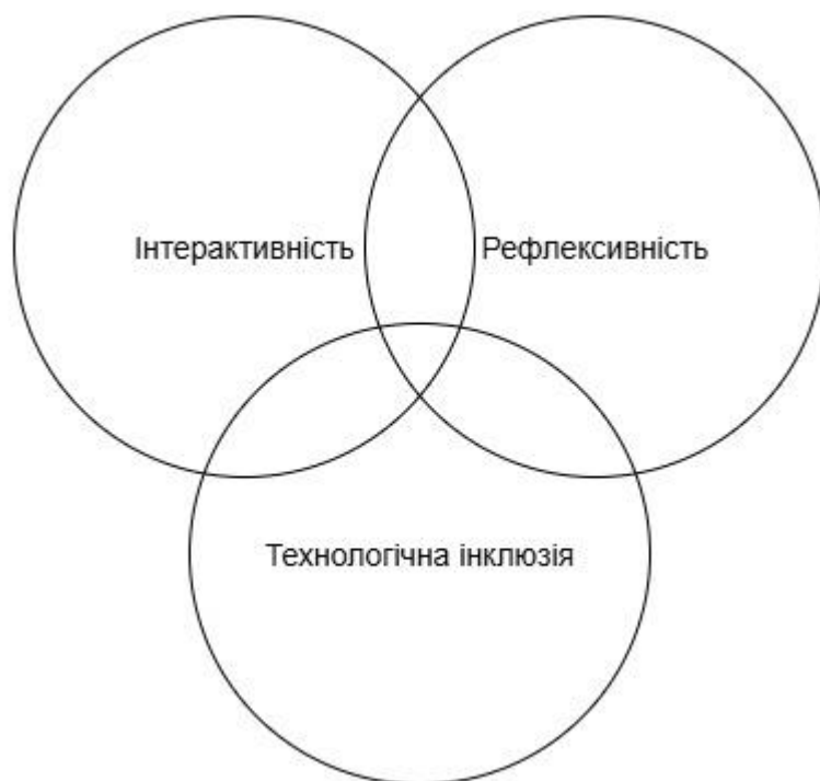
Рис. 2.2. Ефективна дидактична модель розвитку МКК у цифровому середовищі

Ефективна дидактична модель розвитку МКК у цифровому освітньому середовищі (рис. 2.2) включає три взаємопов'язані компоненти: інтерактивність — навчання через діалог і спільне створення знань; рефлексивність — осмислення культурного досвіду; технологічна інклюзія — забезпечення рівного доступу та використання технологій як інструментів соціальної справедливості.