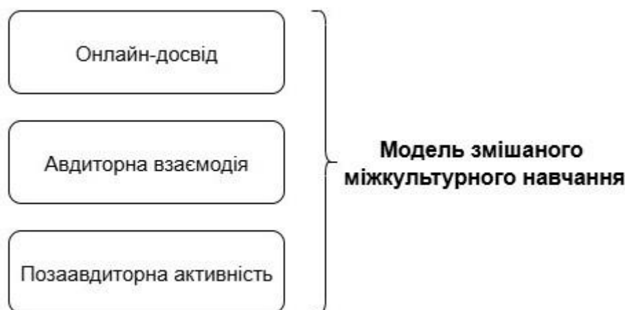
Рис. 2.4. Модель змішаного міжкультурного навчання

Таке поєднання забезпечує цілісний розвиток компетентності — когнітивної, емоційної й поведінкової. Форми організації освітнього процесу у формуванні міжкультурної компетентності студентів охоплюють широкий спектр — від традиційних занять до цифрових і соціально орієнтованих практик. Їх ефективність визначається інтеграцією навчального, соціального й культурного досвіду; створенням умов для взаємодії студентів різних культур у