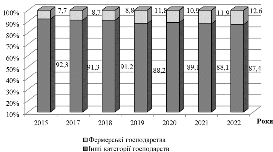
Рис. 2. Частка виробництва основних видів продукції сільського господарства фермерськими господарствами у загальній сукупності

земель. Продукція яка вироблялась в переважній більшості експортувалась у вигляді сировини переробним підприємствам на іноземні ринки. Фермерськими господарствами у вказаний період використовувалось лише 15% сільськогосподарських угідь, переважно господарствами з сімейною формою ведення бізнесу. В останні роки цей показник зростає. Варто зазначити що подальша динаміка розвитку фермерства в Україні значною мірою залежить від ефективного функціонування ринку землі та державної підтримки.