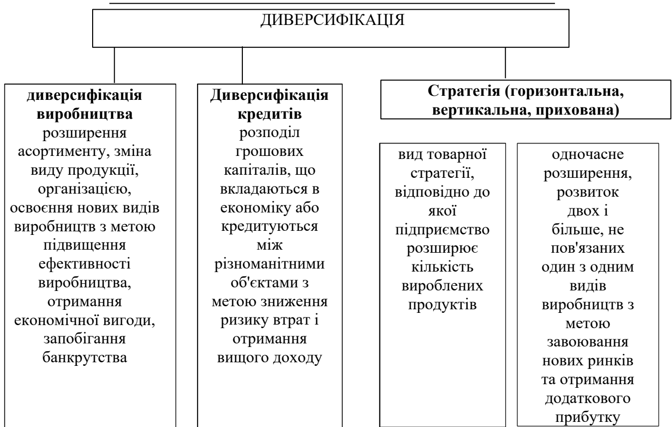
Рис. 1 Різноманітність поняття «диверсифікація»