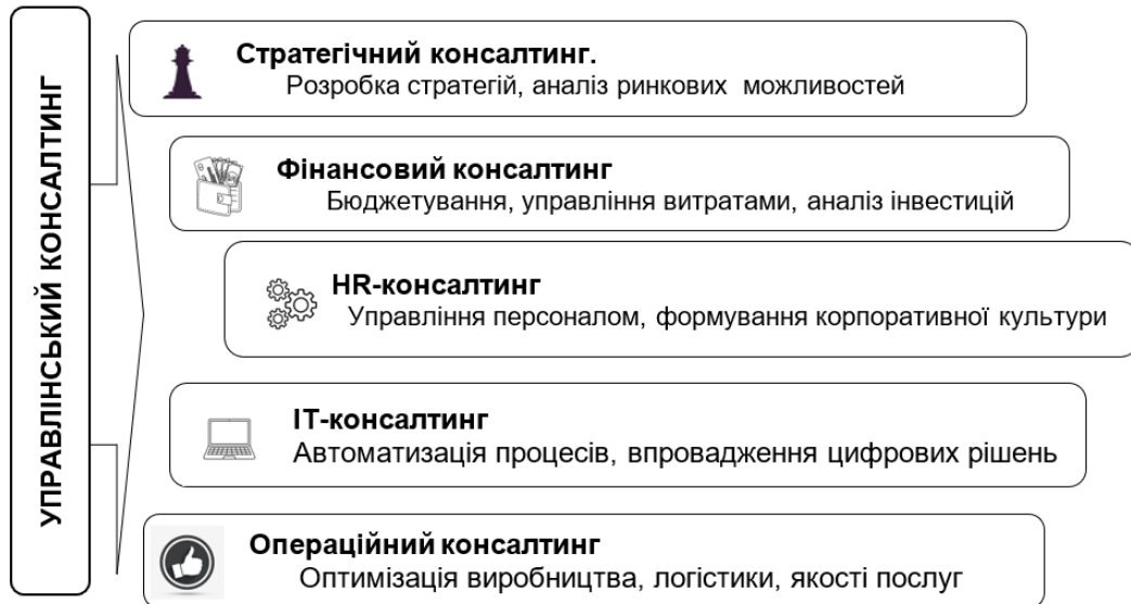
Рис. 2. Напрями управлінського консалтингу залежно від специфічних потреб та цілей організації

Важливо, що консалтинг здатен адаптуватися до викликів глобалізації, цифрових трансформацій та ринкової турбулентності.