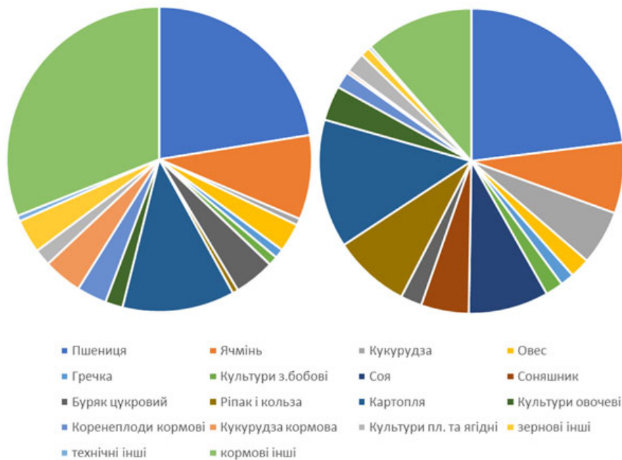
Рис. 1. Розподіл посівних площ на ріллі Львівщини у роки з мінімальним ( H = 3,06 , 1998 р.) та максимальним ( H = 3,56 , 2017 р.) показниками агробіорізноманіття

загалом чи лише агрокультур на ріллі. Оскільки точний видовий склад багаторічних насаджень вивчений недостатньо, а оцінка біорізноманіття сіножатей і пасовищ потребує окремого дослідження, що виходить за межі цієї роботи, зосередимо увагу на біорізноманітті культур, що вирощуються у рільництві. Статистичний аналіз даних сектору рослинництва Львівської області ( Holovne upravlinnia statystyky ) на основі розрахунку індексу Шеннона свідчить, що він змінюється між 3,06 та 3,56 (у проміжку 1990–2023 років, розрахований за даними 18 культур із яких максимум у 1990–2003 припадав на кормові культури, а у 2004–2023 – на пшеницю; найменше значення 3,06 індексу зафіксовано у 1998 році, а найбільше 3,56 – у 2017 – розподіл посівних площ у ці роки наведено на рис. 1 ) і має середнє значення 3,29 при можливому максимумі для цієї кількості культур у 4,17.