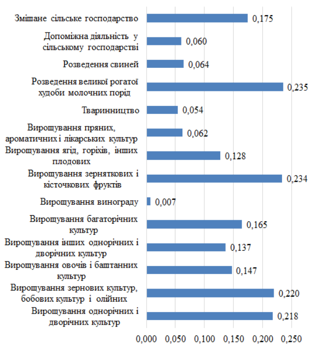
Рис. 2. Вагомість впливу зміни ставки податку на прибуток на чисту операційну рентабельність вирощування основних видів сільськогосподарської продукції у підприємствах України, 2024 р., в.п.

Оптимізація системи оподаткування для сільськогосподарських підприємств, на наш погляд, повинна сприяти якісній трансформації галузевої структури аграрного сектору України з метою підвищення економічного потенціалу та забезпечення продовольчої безпеки за основними видами продукції.