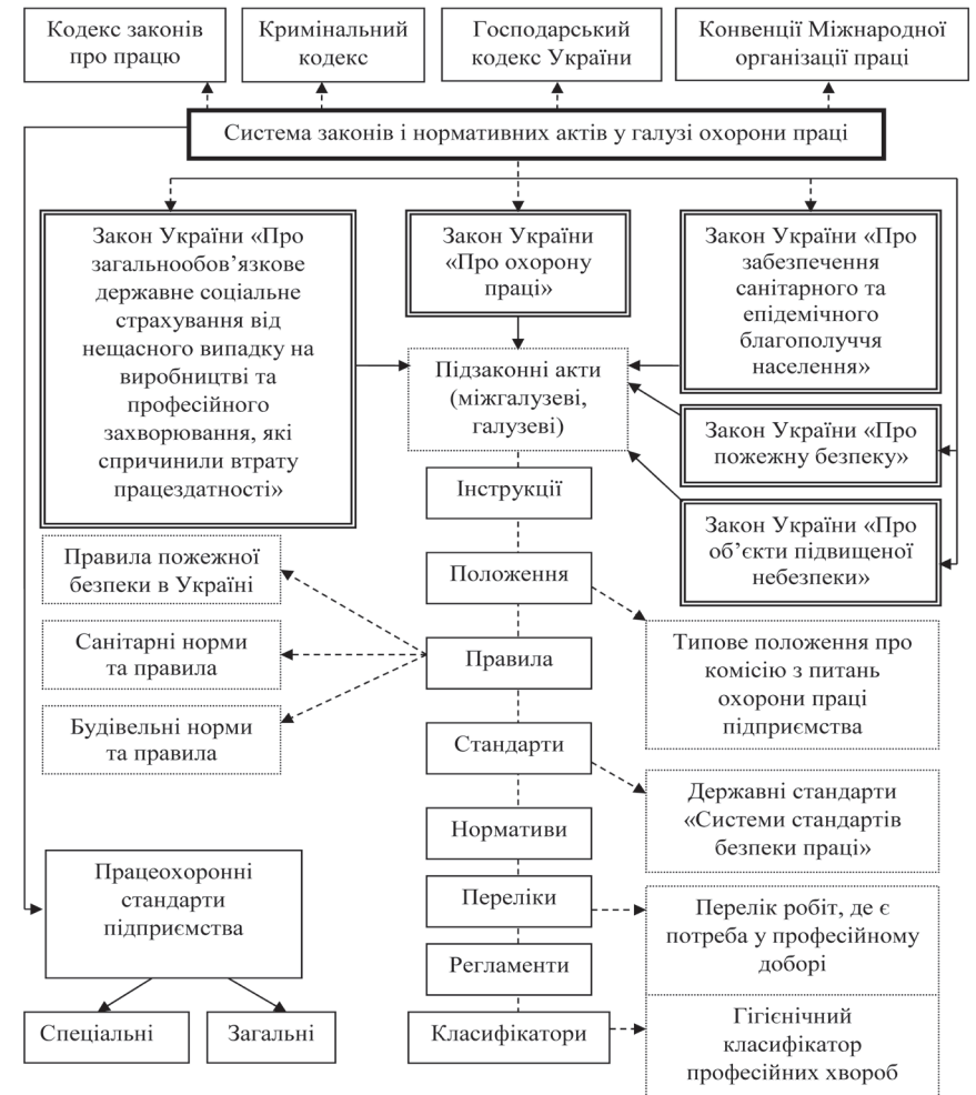
Мал. 1. Блок-схема багаторівневої системи нормативних актів у галузі охорони праці

До найважливіших нормативно-правових актів з питань охорони праці належать державні нормативні акти про охорону праці (ДНАОП), які залежно від сфери дії поділяються на міжгалузеві та галузеві.