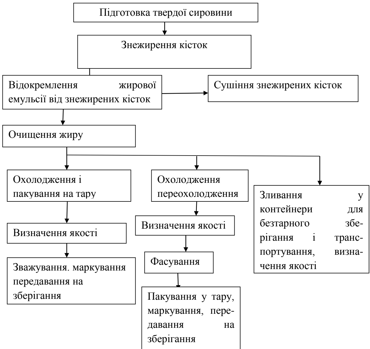
Технологічна схема витоплювання жиру із твердої сировини