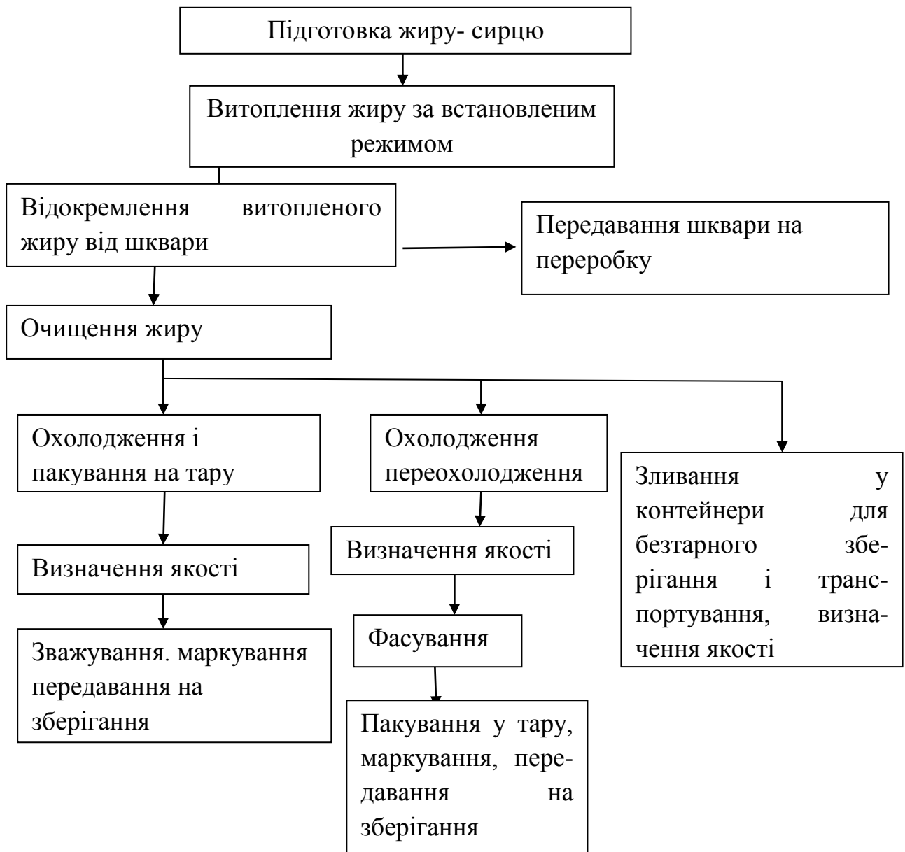
Технологічна схема витоплювання жиру із м'якої сировини