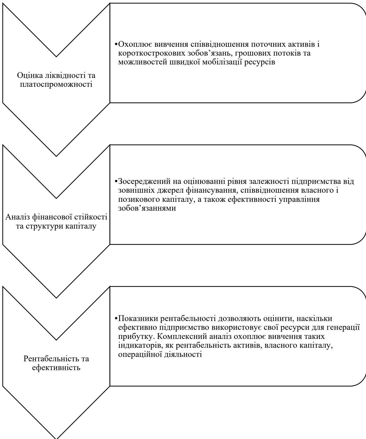
Рис. 1. Ключові параметри проведення комплексного аналізу фінансового стану сучасного підприємства