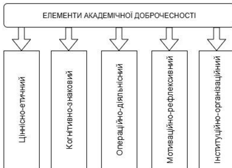
Рис. 1.1. Структура академічної доброчесності

Отже, еволюція поняття академічної доброчесності свідчить про поступовий перехід від індивідуального морального імперативу до інституційно-соціального феномена, в якому етика, культура, правила та технології взаємодіють. Сучасний дискурс підкреслює, що доброчесність – це не лише правило, а практика культури навчання, відповідального ставлення до знання, взаємної довіри в академічному середовищі.